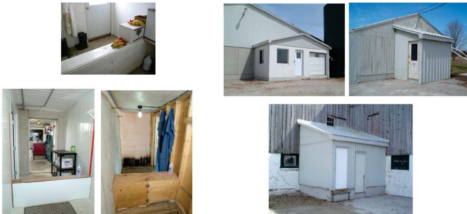
Figura 4. Ejemplos de Entrada Biosegura